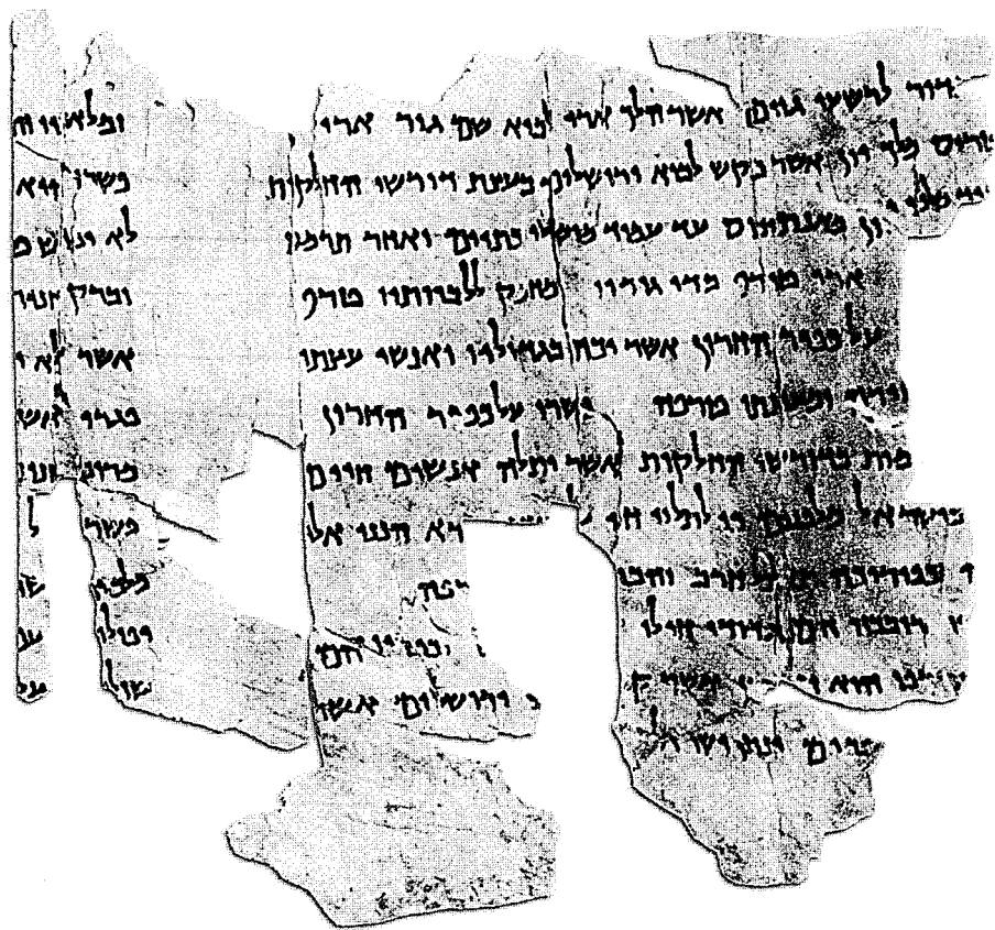
פשר נחום, 4Q169, טור א ותחילת טור ב

הכתיים בתיאורים אסכולוגיים (במדבר כד, כד ; דניאל יא, ל), חשוב היה לאנשי קומראן לזהותם. במאה השנייה לפסה"נ זיהו אנשי קומראן את הכתיים בסלווקים. זיהוי זה מתועד במגילת המלחמה, שמופיע בה הצירוף 'כתי אשור' (1QM, טור א, שורה 2), 40 וכן בפשר ישעיה א, המתאר את נפילת הכתיים ביד ישראל (4Q161, קטעים 8–10, טור ג, שורות 1–9). מאוחר יותר התברר לסופרי קומראן שיום ה' לא הגיע במהלך תקופת השלטון הסלווקי, והם החלו לזהות את הכתיים ברומאים. זיהוי זה מתועד פעמים אחדות בפשר נחום (4Q169, קטעים 3–4, טור א, שורות 3–4) ובפשר חבקוק (ראו למשל: 1QpHab, טור ב, שורה 12 – טור ג, שורה 13). 41 שינויים מסוג זה היו מאוד לא פשוטים כאשר הועלו הפשרים על הכתב, אך היו הרבה יותר קלים כשמדובר בתורה שבעל-פה. לפיכך ייתכן שהחל מאמצע המאה הראשונה לפסה"נ הפסיקו סופרי קומראן להעלות את הפשרים על הכתב, והסתפקו בהצבעה בעל-פה על משמעותם האקטואלית של נבואות ושל מזמורים מקראיים. 42