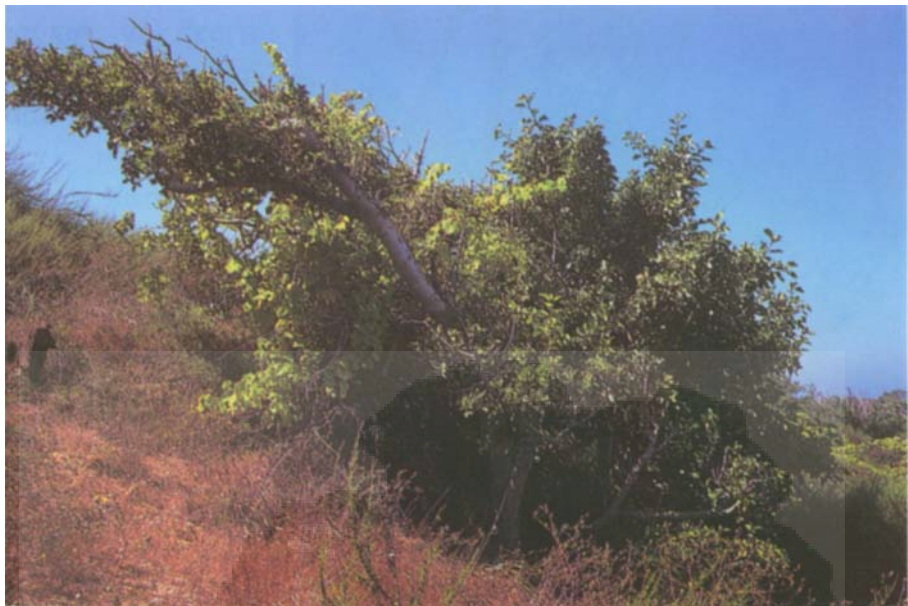
שקמים וגפן באשקלון: עץ שקמה עליו גדלה הגפן נושאת הפירות הנראית בתמונה בעמוד הקודם.

הוריי סיפרו לי כי בשנות החמישים היו יוצאים לבצור ענבים בחולות. בתחילה הדברים לא היו ברורים לי. לא הבנתי מה יש לבצור בחולות! רק מאוחר