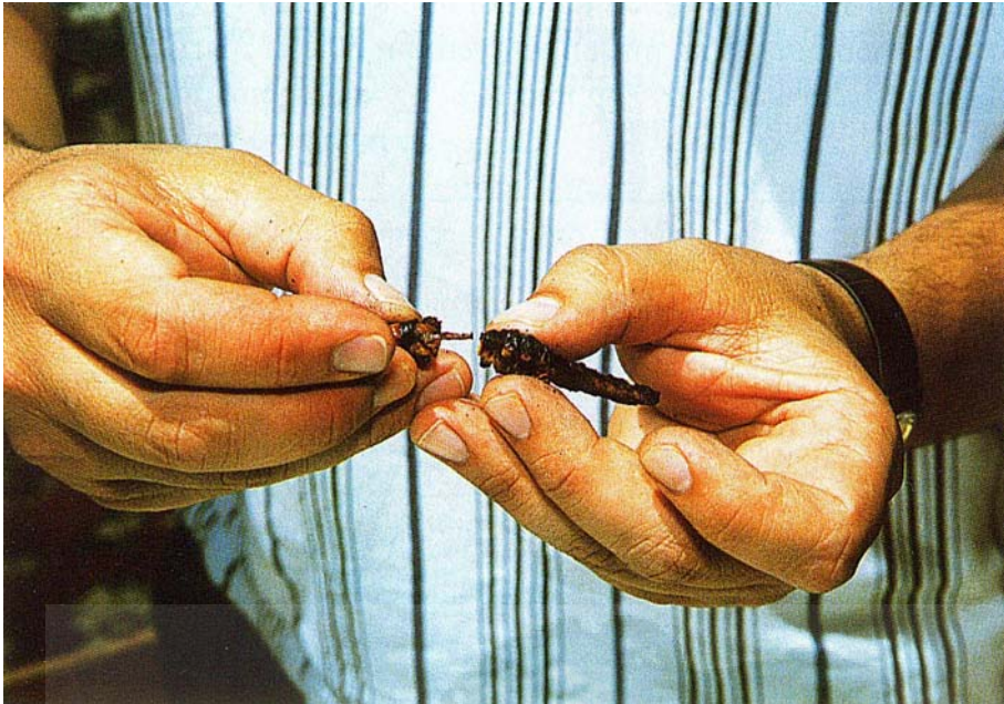
איור מספר 1: הסרת ראש הארבה.

על אשר שאלני השר המרומם האדון איוב לודולף בעיר פרנקפורט: - אם הארבה הבא בארצנו הכל מין אחד כזה המצויר אצלו? - על הרוב הוא כך, אלא שיש יותר גדולים ויותר קטנים. - כמה גדולים היו? - היותר גדולים שראיתי יהיה ג' פעמים גדול מאלו ויש לה שלשה זוגות שיניים. 24