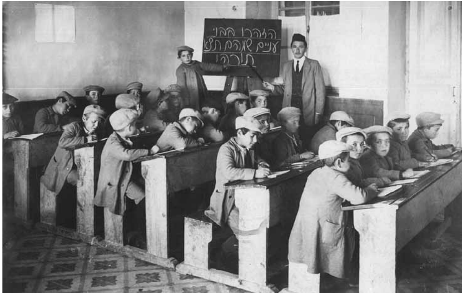
תלמידים בבית הספר של המוסד (באדיבות ארכיון בית היתומים 'ציון בלומנטל')