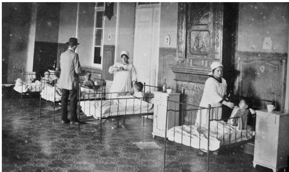
מחלקת החולים של בית היתומים, 1928-1917