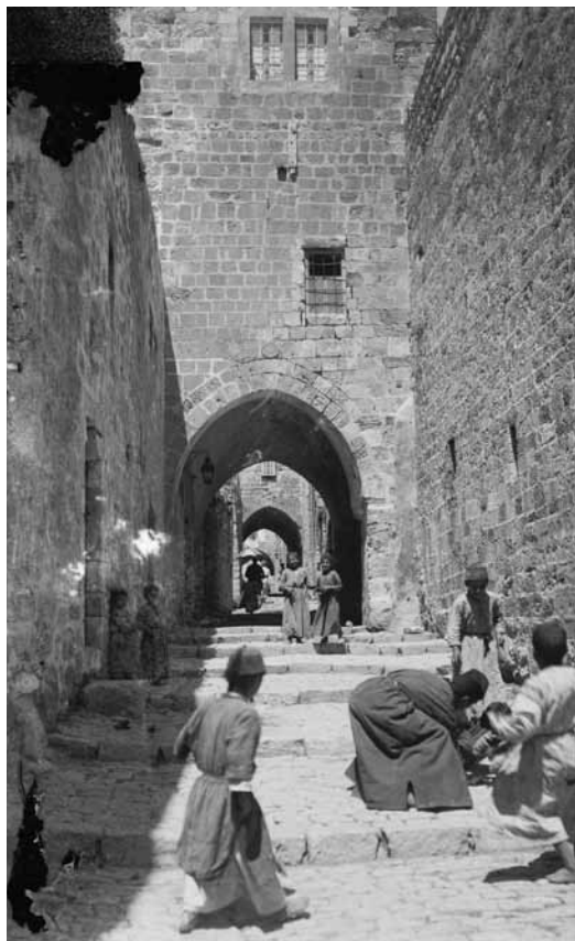
ילדים ברחובות ירושלים, המחצית הראשונה של המאה העשרים

מתיאורו הקשה של הילד, שלא השתמרו פרטים על זהותו מלבד העובדה שנקלט לבסוף בבית היתומים 'ציון בלומנטל', מצטיירת החוויה הקשה של היתמות בירושלים בימי המלחמה. הילד שכב עם חבריו בחוצות העיר, גווע ברעב ומותש, וזעק בקול ניחר אל העוברים והשבים. התחושה החזקה ביותר העולה מן הטקסט היא חוסר האונים של הילדים. 'אין מכיר ואין מרחם!', אין מי שיפנה אל הילדים נפוחי הרעב וייתן להם פת לחם. בתיאורו של הילד בולטת זעקתם של הילדים לעזרה: 'דשואן דשואן!' – הכוונה לכיטוי הערבי جوعان, רָעַב (בתעתיק העברי המקובל היום: ג'ועאן). בקריאתם הנואשת לעזרה השתמשו