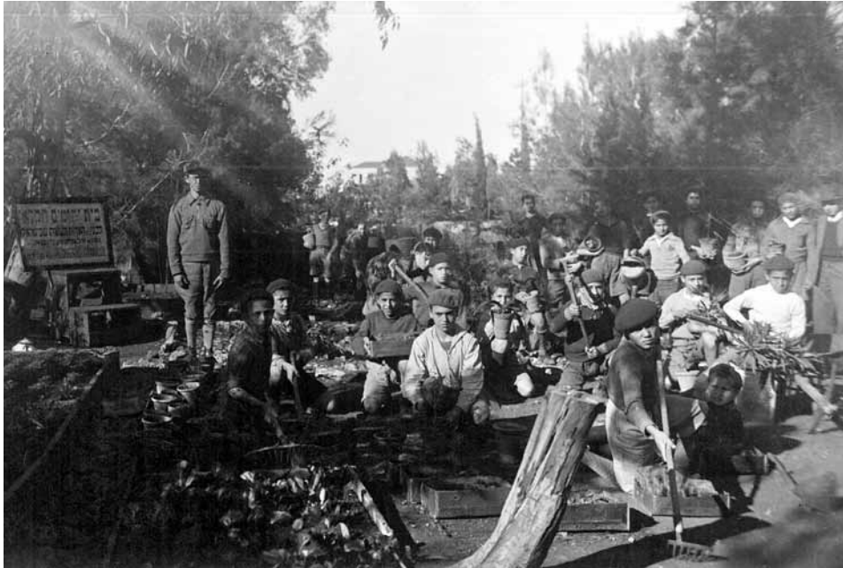
הסניף החקלאי של בית היתומים במוצא

היה נדיר ב'יישוב הישן' באותם הימים. אף שלושים שנה לאחר הקמתו עדיין נחשב הדבר למרשים בירושלים, כפי שעולה מדבריה של הירושלמית האלמונית – ולמעשה בחוגים מסוימים בירושלים הדבר נחשב לחריג אף כיום: