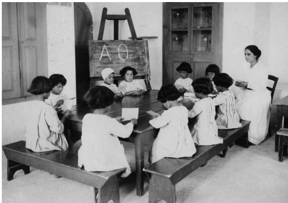
בית הספר בבית היתומים 'כריסטיאן הראלד', ירושלים, 1919