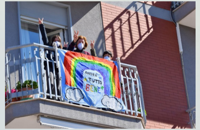
"יהיה בסדר" עם ציור קשת בענן - איטליה

קדושה) ובאיטליה מוכרים בה גם פיצה עטופה (כמו סמבוסה).