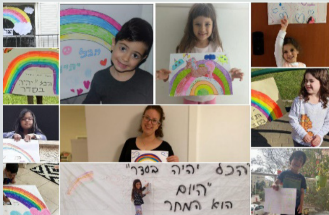
"יהיה בסדר" עם קשת בענן ישראל