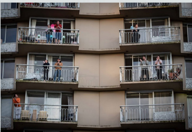
מחיאיות כפיים מהמרפסות - צרפת

רבים סוברים שגלובליזציה היא אימוץ של התרבות ואורח חיים האמריקאיים (האמריקניזציה) או התרבות המערבית, אך הדבר אינו מדויק. גלובליזציה היא אימוץ של תרבויות ואורחות חיים מכל קצוות העולם. הדבר ניכר למשל באימוץ שיטות טיפול "אלטרנטיביות" מהמזרח הרחוק, שיטות הרפיה והתעמלות כמו היוגה והמדיטציה ואף באימוץ של אוכל אסיאתי כמו הסושי והנודלס. חשוב לזכור שכל חברה שמאמצת